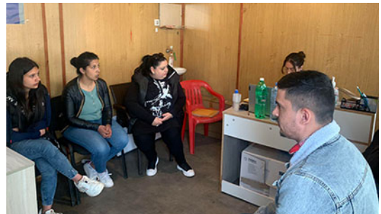
Теренски посети со тимот на Коалицијата и Ромалитико, Хаб на Ромалитико - Штип и Берово

Во рамките на овој проект се изготвени два билтени за детектирани состојби во процесот на пружање на бесплатна правна помош, кои содржат податоци поврзани со областите во кои е дадена правна помош, демографски податоци како и податоци за детектирани слабости на системот и препораки за надминување на истите.