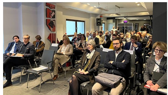
Дел од панелистите и учесниците на завршната конференција, Хотел Солун – Скопје