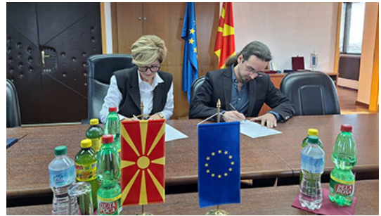
Потпишување на меморандум за соработка со Врховниот суд на РСМ

Главниот продукт кој ќе произлезе преку имплементација на проектните активности е креирање на документ за јавни политики, кој ќе содржи наоди и препораки од страна на судии, јавни обвинители и останати релевантни чинители кои преку работни состаноци и тркалезна маса и други форми на комуникација и соработка ќе ги споделат своите искуства и препораки, во насока на подобрување на ефикасноста на судството. Изготвениот документ за јавни политики ќе биде јавно промовиран и застапуван со цел да се искористи како основ за интервенција во законските текстови, воспоставената практика на постапување, како и реформските процеси кои се однесуваат на судството.