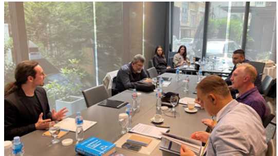
Дел од учесниците на првиот и вториот состанок, Хотел Солун - Скопје

Дополнително, Коалицијата организираше три панел дискусији наменети за општата јавност, односно за граѓаните на тема: