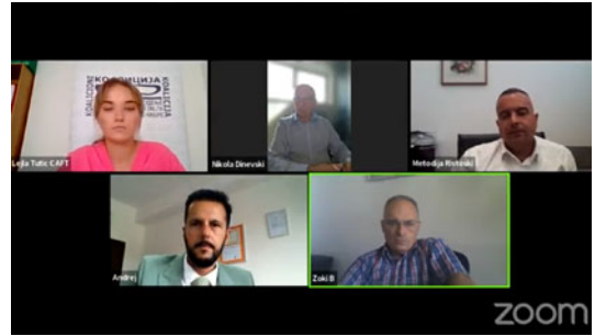
Дел од учесниците на панел дискусиите, Платформа Зоом

Покрај горенаведените активности беше спроведен мониторинг и евалуацијата на целокупната работа на Судскиот совет и Советот на јавните обвинители во Република Северна Македонија, па така за време на оваа активност беа мониторирали вкупно 44 седници на Судскиот совет како и 22 седници на Советот на јавните обвинители на РСМ.