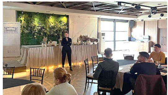
Дел од учесниците на првата обука за набљудувачи, Рзгуза 360 - Скопје

Дополнително, Коалицијата организираше и три работни состаноци, со претставници на релевантни чинители, што беа спроведени на теми актуелни во моментот на нивното организирање на кои се разви плодна дискусија.