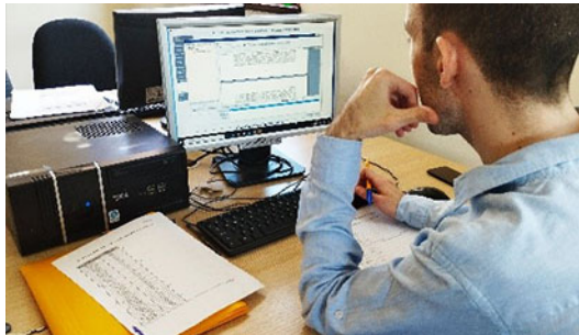
Процес на анонимизирање на пресуди, Основен кривичен суд - Скопје

значително се придонесе кон унапредување на јавноста и транспарентноста на Основниот кривичен суд Скопје.