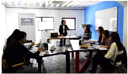
Обука за набљудувачи, Јавна соба

На 06.05.2019 година во рамки на овој проект беше одржана обука за професионални набљудувачи за мониторинг на високопрофилирани предмети од областа на организиран криминал и корупција.