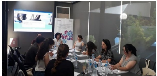
Обука за вршење на увиди во завршени правосилни предмети

На 05.07.2019 година беше спроведена обука за вршење на увиди во завршени правосилни граѓански предмети. Во текот на 2019 година беа направени увиди во завршени граѓански предмети во Основните граѓански судови во Скопје, Велес, Прилеп, Битола, Охрид, Тетово и Струмица.