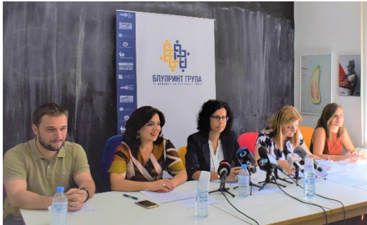
Обука за вршење увиди во правосилни притворски предмети

На 26.07.2019 година Блупринт групата одржа прес конференција во однос на состојбите со статусот на Специјалното јавно обвинителство, во склоп на оваа прес конференција јавноста беше информирана дека проектот „За правда – Следење на спроведувањето на Стратегијата за реформи во правосудството 2019 – 2020“ продолжува и понатаму да се имплементира и Блупринт групата за реформи во правосудството ќе продолжи и понатаму будно да ги следи случувањата во правосудниот систем.