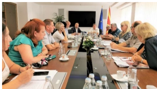
состаноци на работната група за Законот за јавно обвинителство

На тринаесетта седница на Советот за имплементација на Стратегијата за реформи во правосудството, на која Блупринт групата имаше свој претставник, беше разговарано за решенијата за статусот на јавното обвинителство кое е во план да се формира, а би било надлежно за гонење на висока корупција, за прашањата поврзани со Специјалното јавно обвинителство, како и за критериумите за избор на јавни обвинители.