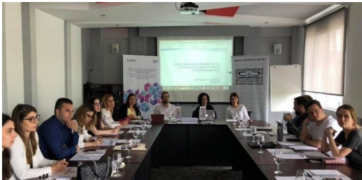
Напредна обука за набљудувачи, хотел Романтик, Велес

Како проектни активности во рамки на овој проект на 05.06 и 06.06.2019 година беше одржана напредна обука за набљудувачи на граѓански постапки кои активно набљудуваат граѓански судски постапки. Целта на обуката беше набљудувачите од различните апелациони подрачја каде што мониторираат да разменат искуства и да ги посочат предизвиците со кои што се соочуваат.