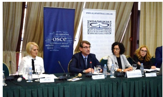
Завршна конференција, хотел Холидеј Ин