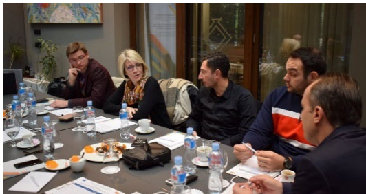
20.12.2019 година, хотел Солун