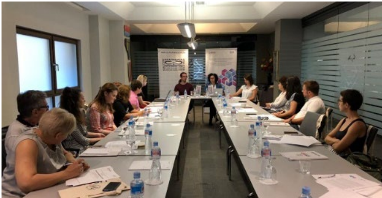
Работна средба, хотел Солун

На 10.09.2019 година во склоп на проектот „Правен, финансиски и физички пристап до правда во основните судови во Р.Македонија“ Коалицијата одржа работен состанок за презентирањето на податоци од изготвениот бриф за физичка пристапност до судовите во Р. Северна Македонија како и дискусија со претставници на организации кои работат со лица со попреченост, а по однос на нивните согледувања на ограничувањата на правата и пристапот до судските објекти и услуги на лицата со попреченост.