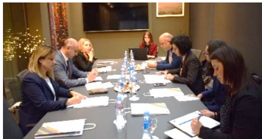
11.12.2019 година, хотел Солун

На 27.09.2019 година и 11.12.2019 година Коалицијата во рамки на проектот „Мониторинг и подобрување на капацитетот на институциите во справување со организиран криминал и корупција“ одржа две работни средби со судии од Основниот кривичен суд Скопје на кои се разговараше за улогата на судот во контролата на главна расправа, предизвици на нејзиното менаџирање како и за примената на мерката „конфискација на имот и имотна корист“. Целта на работните средби е да се овозможи простор за дискусија во однос на позитивните и негативните искуства што ги имаат институциите во борбата против корупција, како и со кои предизвици се соочуваат во текот на работата против организираниот криминал и корупција.