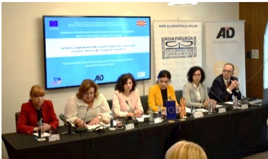
Промотивен настан, хотел Мериот

Во рамки на овој проект на 08.05.2019 година се одржа промотивен настан за започнување на проектот на тема: „Напредокот во борбата против организиран криминал и корупцијата во пресрет на Извештајот на Европската Комисија“ . На конференцијата се дискутираше за предизвиците, проблемите и добрите практики во работењето на институциите кои се борат против организиран криминал и корупција, поточно Државната комисија за спречување на корупцијата, Јавното обвинителство за гонење на организиран криминал и корупција, Специјалното јавно обвинителство, како и Основниот кривичен суд Скопје.