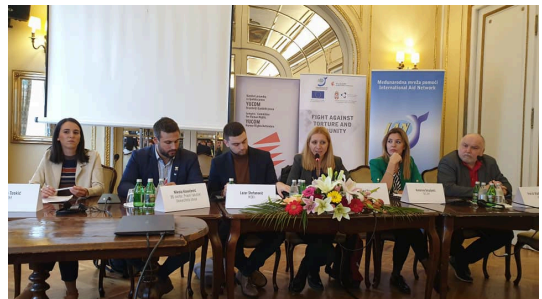
Конференција на проектот „Борба против тортура и неказниост“

Коалицијата како дел од Блупринт групата за реформи во правосудството на 27.11.2019 година пред Собранието на Република Северна Македонија, заедно со десет мрежи на здруженија на граѓани одржаа прес конференција на која повикаа на итен избор и именување на кадар во повеќе институции и тела од страна на Комисијата за прашања на изборите и именувањата. Се работи за институции кои се од исклучителна важност за демократизацијата на нашето општество како: