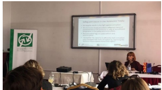
Работилници од областите на преговарачката рамка со ЕУ и споделување на регионалното искуство на земјите од регионот

Како членки на Платформата на граѓански организации за борба против корупција на 13 декември 2019 година во рамки на конференцијата „Исполнување на ветувањето за проширување на ЕУ: 30 години добро управување