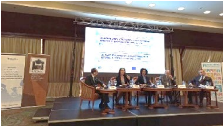
13.12.2019 година, конференција „Исполнување на ветувањето за проширување на ЕУ: 30 години добро управување и антикорупциски реформи во Централна и Источна Европа