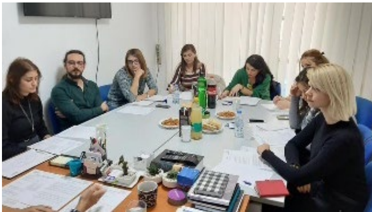
Обука за вршење увиди во правосилни притворски предмети

На 22.11.2019 година Коалиција „Сите за правично судење“ спроведе обука за увиди во правосилно завршени притворски предмети. Нашите набљудувачи во текот на 2020 година ќе собираат податоци за состојбите при изрекување на мерката притвор во Основниот кривичен суд во Скопје.