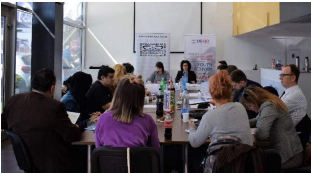
Годишно собрание, 2019 година

На ова Собрание, беше презентирани Годишниот извештај за работата на Коалицијата за 2018 година и беше усвоена Годишната сметка на Коалицијата за 2018 година.