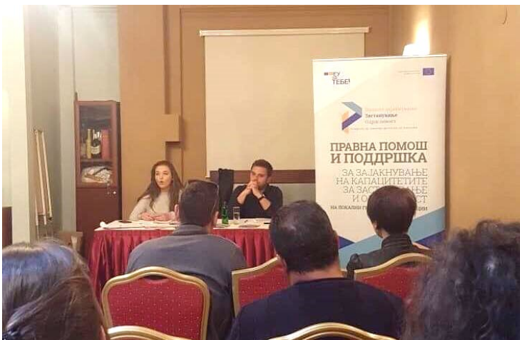
Промотивен настан на канцеларијата за правна поддршка

Во текот на 2019 година, во рамки на проектот беа организирани четири промотивни настани, во следниве градови: Гостивар, Велес, Струмица и Битола. На овие настани, претставниците на граѓанските организации имаа можност да се запознаат со Канцеларијата за правна поддршка на граѓански организации, како истата функционира, каков вид на правна помош нуди како и за начинот на кој што истите можат да се обратат за да добијат бесплатна правна поддршка.