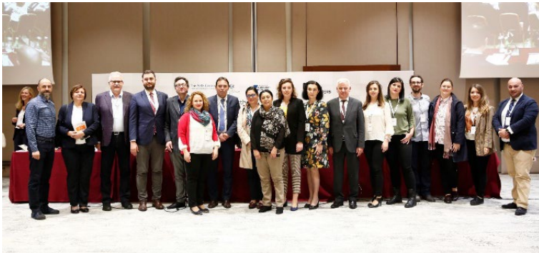
23.03.2019 година, Регионалниот форум за владеење на правото во Југоисточна Европа

Претставник на Коалицијата оваа година учествуваше на Регионалниот форум за владеење на правото во Југоисточна Европа (Annual regional rule of law forum for South East Europe) во Дубровник, Република Хрватска кој се одржа на 22-23 март 2019 година. Во рамки на овој форум беа разменети искуства во поглед на мониторингот и евалуацијата на работата на судовите во различни држави.