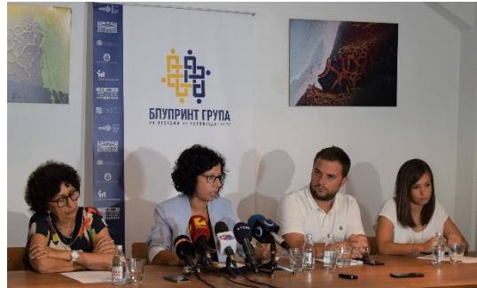
12.09.2019 година, прес конференција

На 12.09.2019 година, Блупринт групата одржа прес конференција посветена на актуелните случувања во областа на правосудството. Блупринт групата ги изнесе своите ставови во однос на Законот за јавното обвинителство и статусот на Специјалното јавно обвинителство, со тоа што потенцираше дека СЈО како институција треба да продолжи со работа во рамки на јавнообвинителскиот систем, согласно хиерархиската поставеност и правила, но притоа да се трансформира во јавно обвинителство на исто ниво со Јавното обвинителство за гонење на организиран криминал и корупција, а со мандат да гони висока корупција. Доказните видео и аудио материјали е неопходно да бидат употребувани и понатаму во постапките, согласно ценењето на судите. Предметите кои што ги води СЈО мора да продолжат и да имаат своја разрешница.