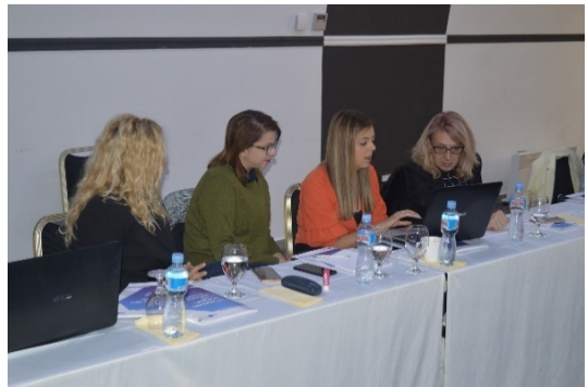
2019, работилници на тема „Методологија за стратешко предвидување и мониторинг и евалуација“