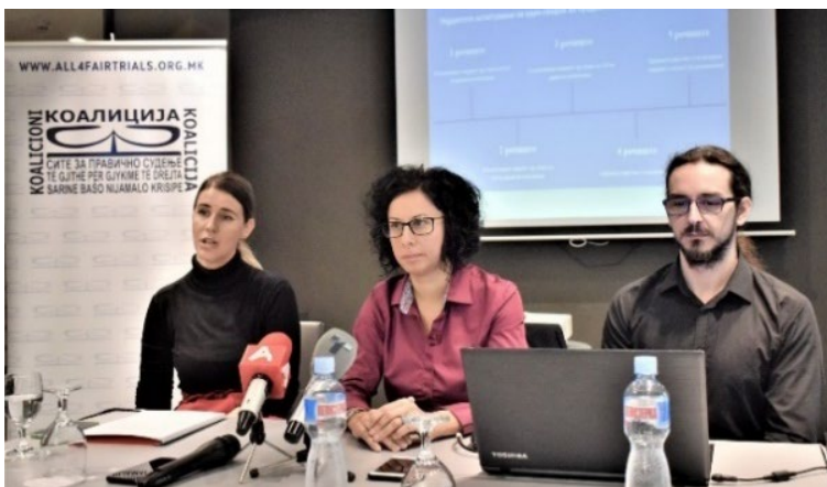
Промоција на веб страницата Судско досие, хотел Солун

Линкот до веб страницата: http://sudskodosie.all4fairtrials.org.mk/