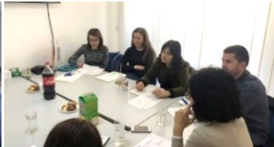
Обуки за набљудувачи на постапки за семејно насилство и организиран криминал и корупција

Во декември 2019 година се одржа завршната конференција на која беа презентирани податоците добиени од мониторингот. На конференцијата како панелисти учествуваа и судии од Основниот кривичен суд Скопје, Основниот суд Велес, Основниот суд Кавадарци, адвокати и граѓански организации кои работат на овие две области на кои што беше спроведен мониторингот.