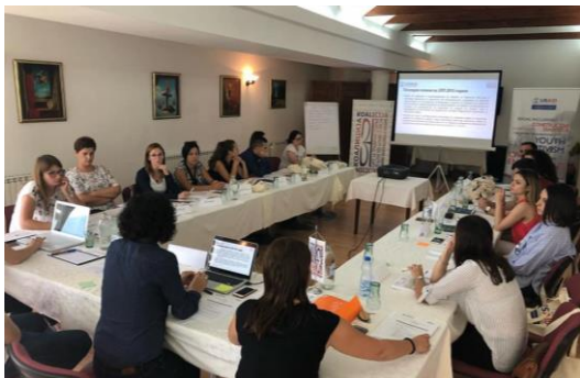
Обука за набљудувачи (х. Бистра – Маврово)

За овој проект, писма за поддршка добивме и од Министерството за правда и Министерството за труд и социјална политика.