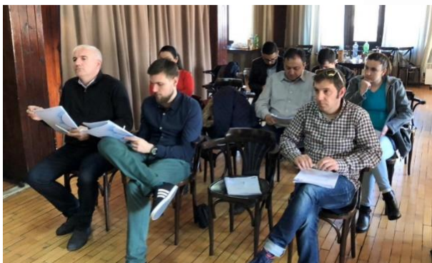
Годишно собрание на Коалицијата Сите за правично судење (ГЕМ Менада)

Поради отсуство на активен придонес како и поради отсуство од работата на органите и оперативните канцеларии на Коалицијата делегатите на Собранието со мнозинство гласови и еден воздржан одлучија да бидат исклучени членките Здружение на тиквешки Роми-Кавадарци, Избор - Струмица и ГИЦ Спектар-Штип.