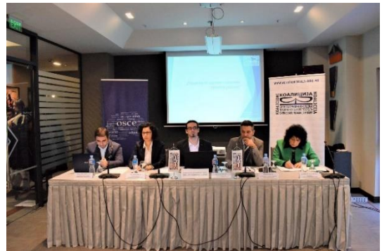
Презентација на резултатите од мониторингот