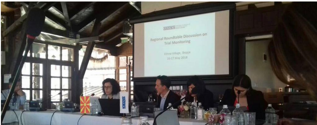
Извршната директорка на Коалицијата беше еден од говорниците на тркалезната маса

На 16 и 17 мај 2018 година, ОБСЕ/ОДИХР организираа тркалезна маса во Скопје за набљудувачите на судски процеси од регионот заради размена на идеи и најдобри практики. Претставници на Коалицијата учествуваа со свои излагања во двете панел дискусии. Целта на оваа тркалезна маса беше да се постават прашањата и да се дојде до одговор на истите како што се: Како лицата кои ги следат судските процеси да известуваат земајќи ги во вид човековите права, публицитетот и предрасудите? Кои аспекти, на пример правото на правично судење на обвинетиот, изречените санкции, собирањето докази и презентацијата од страна на обвинителите, го одредуваат начинот на известување?