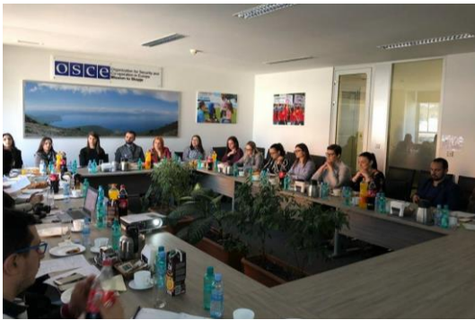
Обука за набљудувачи

конференција имаше и организирана дискусија со јавни обвинители, судии и лица од академската фела во однос на детектираните проблеми што произлегуваат од Законот за кривична постапка.