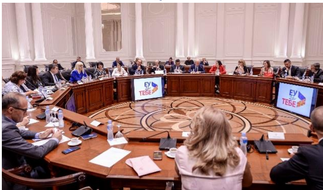
Петта седница на Советот за имплементација на Стратегијата за реформи во правосудниот сектор