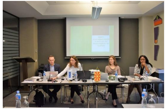
Дел од учесниците и предавачите на напредната обука (Хотел Солун - Скопје)