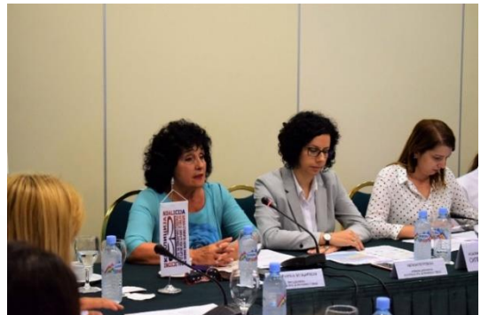
Настани кои што ја одбележаа 15 годишнината на Коалиција Сите за правично судење