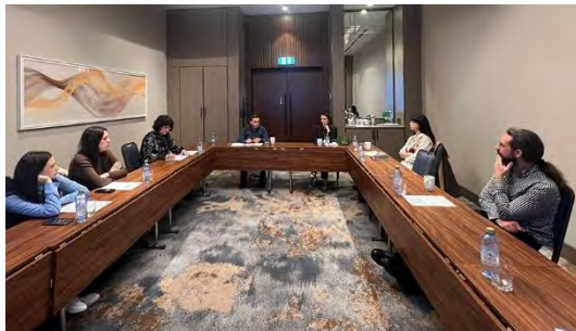
Дел од учесниците на работниот состанок – х. Хилтон, скопје

Во рамки на Годишната програма за работа, Коалицијата организираше три панел дискусии наменети за пошироката јавност, со цел унапредување на правната култура и подобро разбирање на теми од јавен интерес: