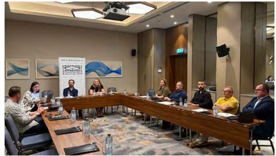
Дел од учесниците на работниот состанок – х. Хилтон, скопје

Вториот состанок, организиран во септември 2025 година, ги обедини судиите од четирите апелациони судови и Врховниот суд. Фокусот беше ставен на прашања од граѓанската и кривичната област за кои постои неусогласена судска пракса. Овој состанок придонесе кон зајакнување на дијалогот меѓу судовите и кон уедначување на ставовите и практиката.