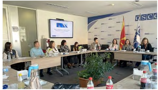
Дел од учесниците на обукаите за набљудувачи, ОБСЕ и ГРЦ - Скопје

За време на овие обуки од страна на предавачите беше објаснет процесот на судски мониторинг, правата и обврските на ангажираните судски набљудувачи како и методологијата која што ќе се користи со цел прибирање на потребните податоци.