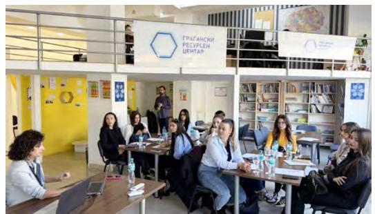
Дел од учесниците на специјализираните обуки, ГРЦ - Скопје

Дополнително, беа организирани две специјализирани обуки за студенти по право, насочени кон препознавање на корупциски ризици, институционални механизми и практични алатки за нивно адресирање. Обуките придонесоа кон зајакнување на практичните знаења и подготвеноста на младите правници за работа на случаи поврзани со корупција.