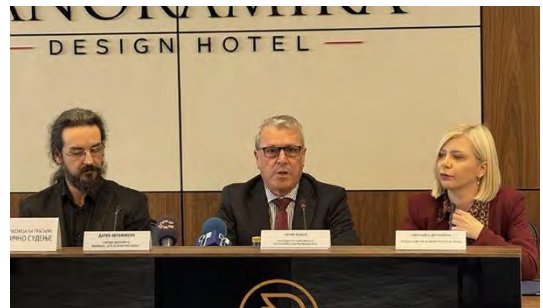
Дел од учесниците на завршната конференција – х. Панорамика, скопје

Податоците добиени од мониторингот беа користени и пошироко – како основа за придонес во релевантни извештаи и процеси, вклучително и извештаите на Европската Унија за владеење на правото и напредокот на земјата, како и во работни групи за законски измени. Дополнително, на месечно ниво се објавуваа мониторинг брифови со преглед на позначајни предмети од областа на организираниот криминал и корупција.