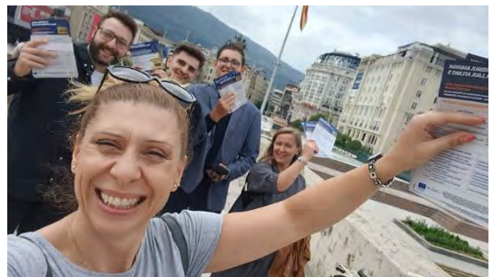
Отворени денови за промоција, Скопје